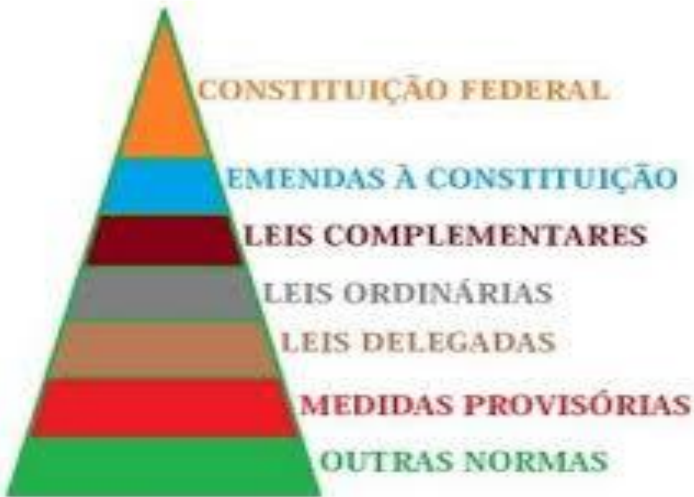
PIRÂMIDE DE KELSEN